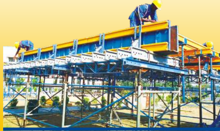
கட்டுமானத்திற்குத் தொழில் பயிற்சி நிலையம் அதிக வேலைவாய்ப்புகளை உருவாக்குகிறது.

தேவை - ஒரு செயல்திட்டம். பொருளாதாரத்தில் பின்தங்கியவர்களுக்கு வாய்ப்பு வழங்கி அவர்களையும் நாட்டின் முன்னேற்றம் பணியில் அர்ப்பணிப்பது. இவை அனைத்தையும் கருத்தில் கொண்டு லார்சன் மற்றும் டுப்ரோ நிறுவனம் 1995-ம் ஆண்டு கட்டுமான தொழில் திறன் பயிற்சி நிலையத்தைத் தொடங்கியது.